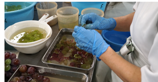
ぶどう（ピオーネ）の皮むき作業の様子